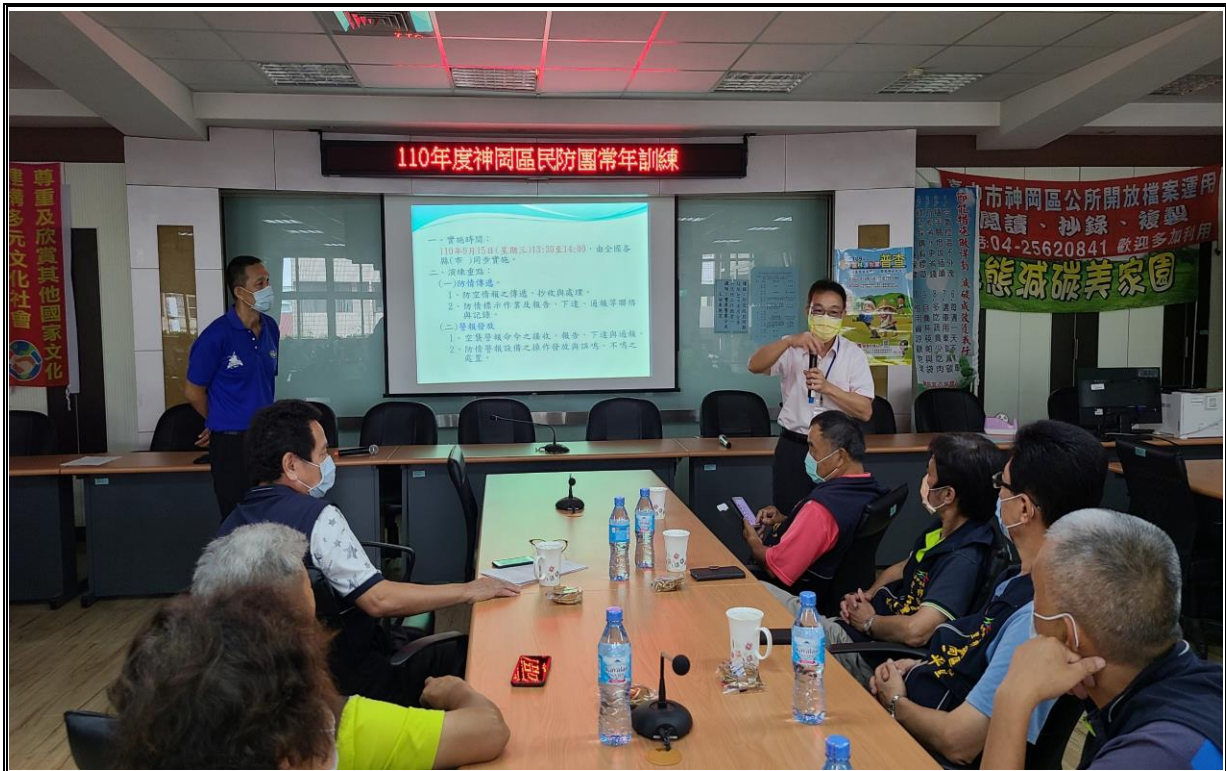
說明 本所高主任秘書致詞