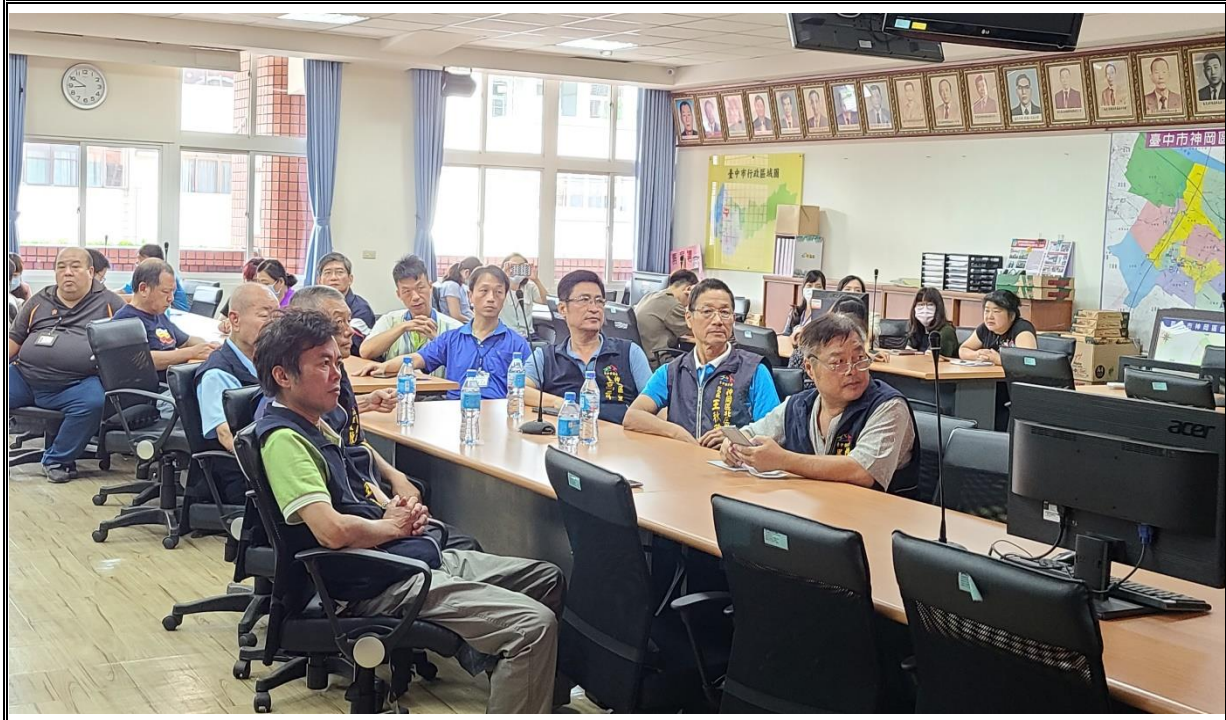
說明 課程名稱：民防相關法令及組訓作業流程